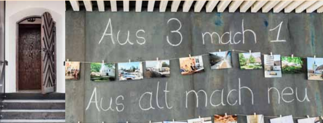
Impressionen der Installation von Pfarrer Fabian Ludwig und der Einweihung des neuen Gemeindezentrums an der Heilandskirche am Pfingstsonntag, 9. Juni 2019