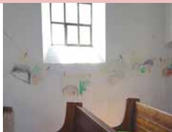
„Der gute Hirte“, Mini- und Kindergottesdienst Mai 2019