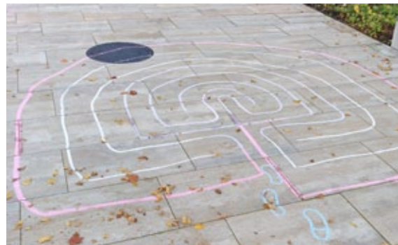
Auf verschlungenen Wegen zum Ziel – nicht nur die Kinder hatten Spaß im begehbaren Labyrinth.