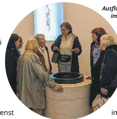
Ausflug der Kantorei nach Augsburg im Juli 2025

Ausgehend von einem Gespräch in kleiner Runde nach dem Gottesdienst zu Dietrich Bonhoeffers 80. Todestag,