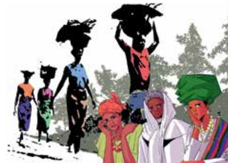
„Rest for the Weary.“ von Gift Amarachi Ottah @ 2024 World Day of Prayer International Committee, Inc.